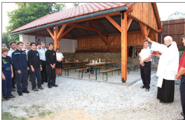
Požehnání novému přístřešku