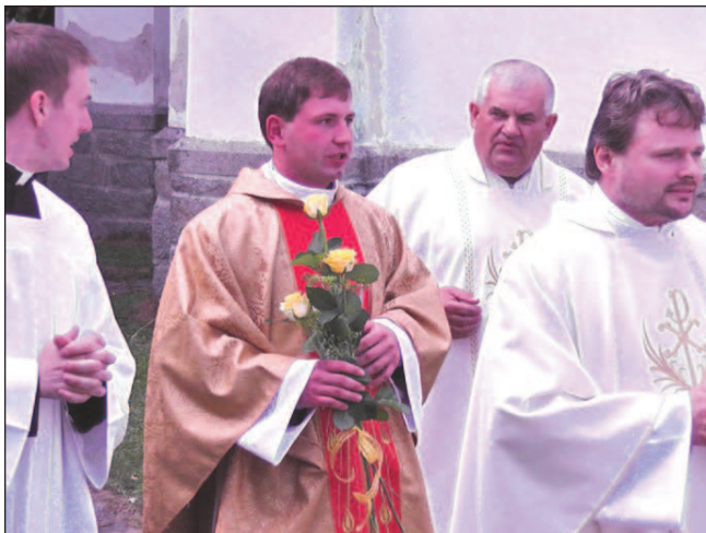
Svou první mši zvládl na jedničku