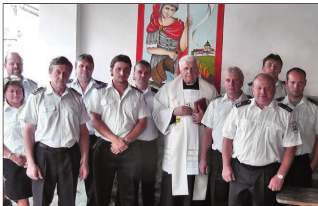
Současné vedení SDH Čkyně pod novým přístřeškem

V těchto dnech čeká čkyňské hasiče další příjemná povinnost. Loni přispěli dvaceti tisícovou částkou na obnovu povodněmi pozměněné obce Zdounky na Kroměřížsku. Zdejší dobrovolní hasiči je na oplátku pozvali na krátkou přátelskou návštěvu. Výlet na Moravu si udělá devět Čkyňáků. (pp)