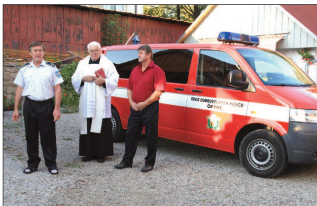
Zbrusu nový hasičský vůz