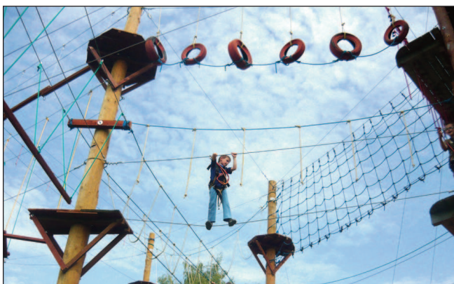
Děti si užily v lanovém centru