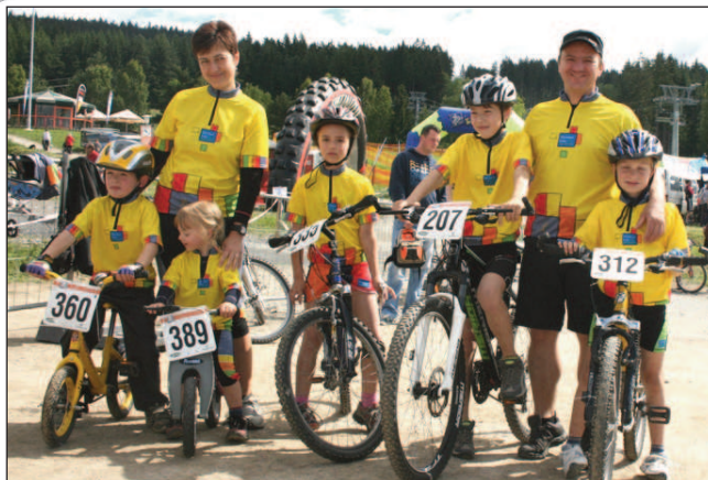
Outdoorkids se svými trenéry

„Trénovat budeme ještě trochu na kole, ale postupně začneme chodit na výlety jako na Boubín nebo i na německý Luzný. Postupně zkusíme běhat, abychom se připravili na podzimní běžecké krosy. Máme také velkou radost z prvního sponzorského příspěvku, ze kterého chceme pořídit dětem vybavení na zimu, tj. běžky, vázání, hůlky, boty a samozřejmě vosky,“